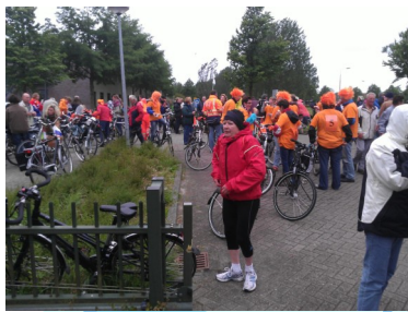
Bij de stempel post in Schagen

Ons groepje vertrok vol goede moed om 10 uur. We fietsten naar de eerste stempel post in Kolhorn. Daar gingen we blindelings achter een